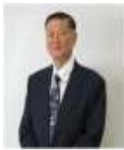
ดาโต๊ะ ชรี ตัน บูน ปิน (Dato Seri Tan Boon Pin)